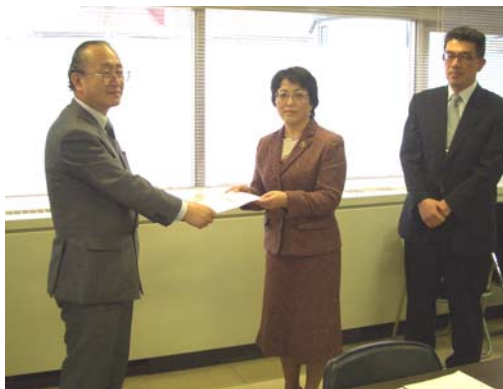
(平成18年12月20日第6回懇話会において提言)