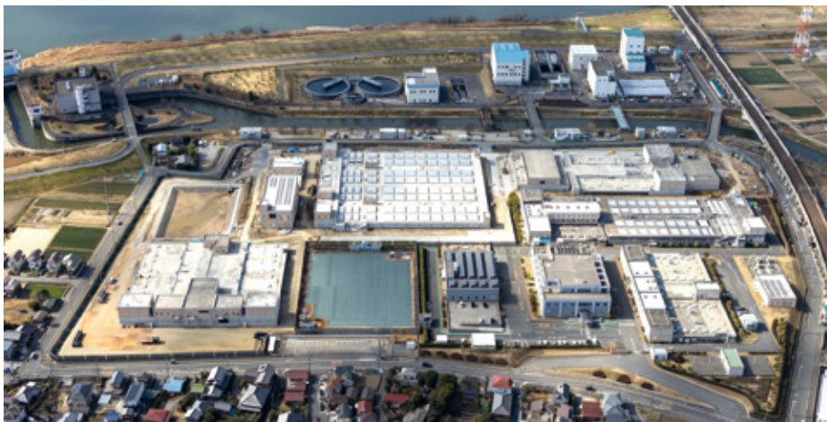
ちば野菊の里浄水場(松戸市)

企業局では今後も安全で良質なおいしい水を安定的に供給するため、懸命に努力します。今後とも水道事業の運営に、ご理解・ご協力をお願いします。