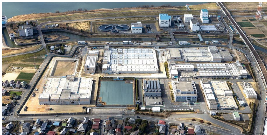
ちば野菊の里浄水場(松戸市)

企業局では今後も安全で良質なおいしい水を安定的に供給するため、懸命に努力します。今後とも水道事業の運営に、ご理解・ご協力をお願いします。