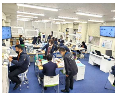
令和3年1月現在の執務室