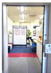
バリアフリーの受付