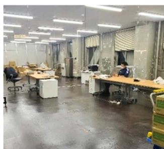
令和2年4月1日の執務室

また、体調の悪いスタッフが休憩できるようにソファベッドを配置したクールダウンスペースを設け、業務の予定や進捗、出退勤予定などの見える化を図るため、大型モニターやホワイトボードを設置しました。