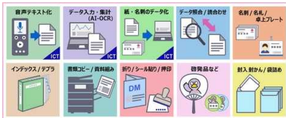
業務メニュー一覧

説明会等の資料コピー及び資料組みなどを基本メニューとして設定しており、この他にも、各所属の要望に応じた業務に対応しています。