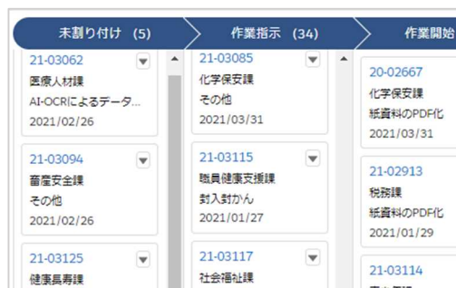
受注管理システム