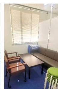
クールダウンルーム