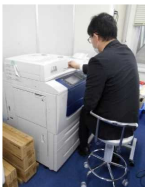
スキャン作業 足の障害があり、長時間の立ち作業が困難のため、昇降椅子を購入

今後も引き続き、障害のあるスタッフと接する機会を庁内で創出し、より多様な方々が働ける埼玉県庁を目指していきます。