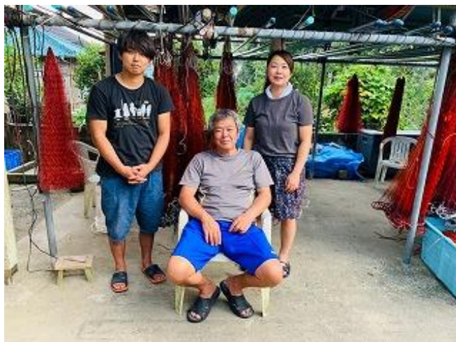
図3 我が家の家族（左から弟、父、私）