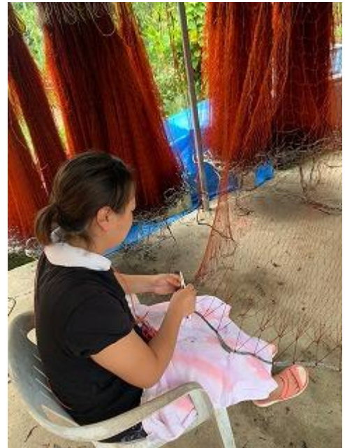
図6 イセエビ刺網の修理

身体が資本の職業なので、家族の健康はもちろん、私の気力、体力がどこまで保てるかは少し気がかりだ。また、父が中核的漁業者として認定され、今年度末から水産業競争力強化漁船導入緊急支援事業(漁船リース事業)で小型船の代船建造が始まる予定である。しかし新しい船で用いる備品や機器類などは、物価高騰や半導体不足の影響を大きく受けるため、先々に不安が残る。