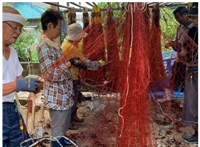
図7 手伝い人の皆さん

イセエビ刺網漁は、網からイセエビやサザエなどを速やかに外すため、人手が必要であるが、どこでも人手不足に悩んでいると聞く。我が家ではイセエビ刺網漁の時期には、近所の人「手伝い人」として働きに来てくれるが、その方々も後期高齢者と呼ばれる世代である（図7）。いつまでお願いできるか分からない状況にあるが、皆さん勢いのある方々ばかりで、中には現役引退後に地元に戻り漁を助けてくれる人もいます。我が家にお集まりいただく皆さんも、「来年は生き