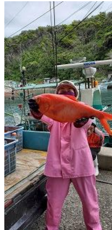
図5 私が釣った キンメダイ

弟が海上技術学校を卒業し、跡継ぎとして家に戻ってきたら、私は船を下りるつもりだったが、その間に祖父母が他界し、家の中も慌ただしく、がむしゃらになって働いているうちに気づけば8年が経過、私は30歳になった。家族で漁に出る日々は充実していたが、私が乗船した当初から、漁家経営に対して漠然とした不安を抱えていたのも事実だ。この8年の間に不安の一つ一つと向き合ってきたことで、「生涯を通じて」と言える勇気はまだないが、これから先も長く家業に従事して、家族を支えていきたいと思えるようになった。