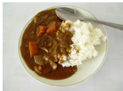
写真4 サザエカレー

浜にはそこで採れる貝類を使った御当地カレーというものがあります。ハマグリで有名な九十九里一帯にはハマグリカレーというものがあるそうですが、サザエの産地である夷隅地区ではそれがサザエカレーになるわけです。肉が高価だった時代に、肉の代わりにサザエを入れた訳で