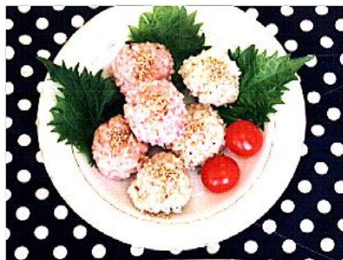
写真6 サバのもち米蒸し

サバの身を叩き、ショウガ、タマネギ、シイタケ及びタケノコをみじん切りにした物と卵白、パン粉を混ぜ合わせた団子を作り、その周りを紅白のもち米で包み蒸したものです。蒸しあがったものに白ゴマをかけ熱々でいただくわけですが、味良かつ彩り良くということでこれも大変好評なメニューの一つです。