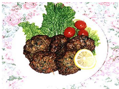
写真3 イワシのじやじや

それではここで、その120品の中から代表的ないくつかの料理を紹介したいと思います。