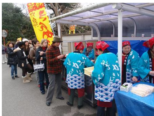
写真7 勝浦ビッグひな祭りでの活動

その他にも、当地区で代表的なマダコ、イセエビ、スルメイカ、カツオ、ヒジキなどを使った様々な料理がありますが、紙面の関係上紹介はこの位にしておきます。なお、レシピ集については千葉県勝浦水産事務所のホームページに今後掲載される予定なので、興味のある方は是非御覧になってみてください。