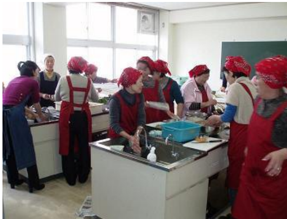
写真1 料理講習会の様子

料理講習会は通常 1 支所当たり 2~3 名が参加し、総勢 20 名前後で行ないます。料理は各支所から必ず 1 品は出すので、1 回の講習会で最低 9 品はメニューが追加されることとなります。そして、でき上がった料理については、参加者の他に地元の水産事務所や信漁連の職員を招き試食会を行ないます。また、レシピは料理献立集として纏められ、参加者が地元の女性部員に配布しそれを広めていきます。