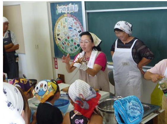
写真8 漁業士会料理教室にて活躍する会員

夷隅地区女性連の会員は、この料理講習会を通じて習得した料理を各自の地元イベントで作り配布するなどして、精力的に魚食普及活動を行っています。また、女性連の会員の中には県等から認定された漁業士、おさかな普及員といった立場の人も多く、地元の小学生親子などを対象にした料理教室、市の公民館主催の料理教室、漁業士会主催料理教室など幅広く活躍していますが、こうした場ではいつも夷隅地区女性連の料理献立集が活用されています。