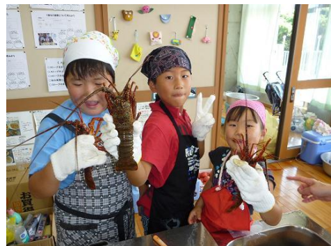
写真9 元気な子供たち (漁業士会料理教室にて)

以前の話ですが、勝浦の子供が都会に出て、魚を捌けないということで笑われたという話を耳にしたことがあります。漁村出身だから魚が捌けなければならないということはありませんが、この話を聞いた時に、私は漁家生まれの人間として恥ずかしさを感じたものです。というのは、これは単に魚捌きができるか否かという問題ではなく、漁村においても魚離れが存在する結果ではないかと考えたか