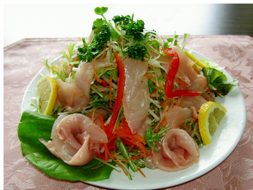
写真5 キンメダイのカルパッチョ

すが、今では肉より高価な食材となってしまいました。カレーの中にサザエの食感と味が広がり、地元民が愛するメニューとなっています。