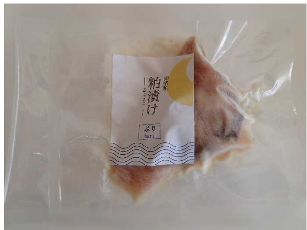
図 7 イナダ（ワラサ）の粕漬け

レシピに従って製造した粕漬けを平成 27 年 9 月、10 月に開催された「おんじゅく伊勢えび祭り」において、販売試験及び試食アンケートを行いました。2 回実施したアンケートでは、おいしいという評価がそれぞれ 89%、84%と高い割合を示しました。また、購入の目的と価格についても設問を設けましたが、圧倒的に自宅用が多く、価格については 200 円台という回答が多く寄せられており、味については好評であったことから、今後はアンケートの結果も参考にしながら、販売戦略の検討を進めていきたいと考えています。