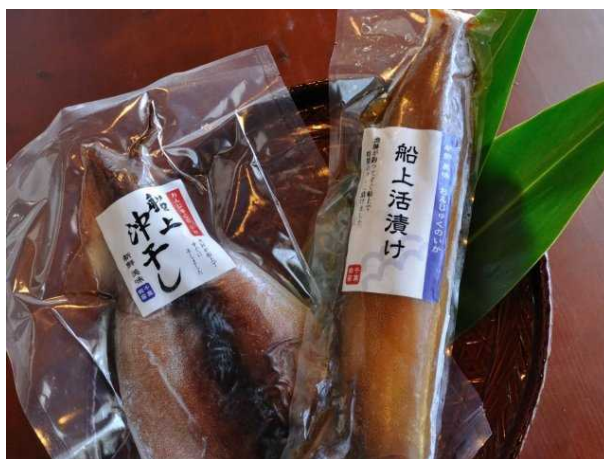
図 4 イカの沖漬け・沖干し

平成 22 年度は、青年部の取組と漁協の事業化試験が併存する形となりましたが、平成 23 年度からは 漁協が正式に事業化する方向で動き出すことになったことから双方を統合し、加工を漁業者が行い、集荷・販売を漁協が行うこととなりました。平成 23 年 9 月、10 月に行われた「おんじゅく伊勢えび祭り」に漁協として出店し、沖漬け・沖干し（図 4）の販売を行いました。販売数は、合わせて沖干し 55 枚、沖漬け 330 本で用意したものは完売しました。売り上げは 231,000 円となりました。