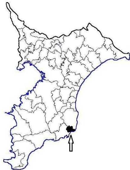
図 1 御宿町の位置

御宿町周辺の海岸は、岩礁帯の合間に砂浜が点在しており、沖合には黒潮が流れ、大陸棚に続いて海山や海底谷が存在し、これらの多様な漁場を利用した漁業が盛んです。