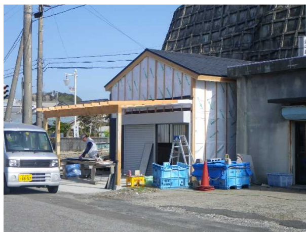
図 5 イカの沖漬け・沖干し加工施設

漁協の販売試験は順調にいていきましたが、加工施設については地元の水産加工業者に間借りしている状況であり、生産に支障をきたす恐れがありました。このことから漁協で加工施設を整備することとし、平成 24 年度に国の「6 次産業化推進整備事業」