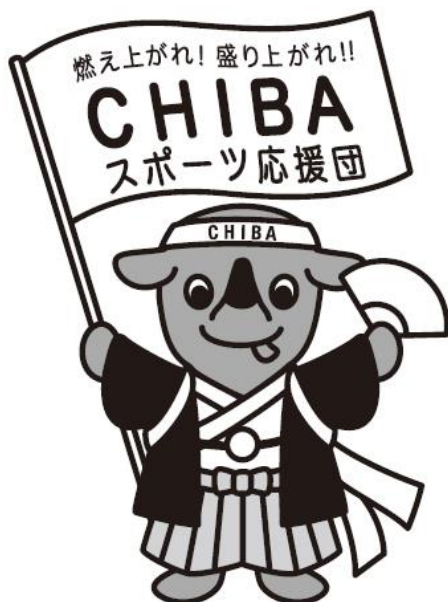
スポーツ応援チーバくん

※但し、使用サイズに応じて「チーバくん」(英文：CHI-BA+KUN)のみでも可とする。