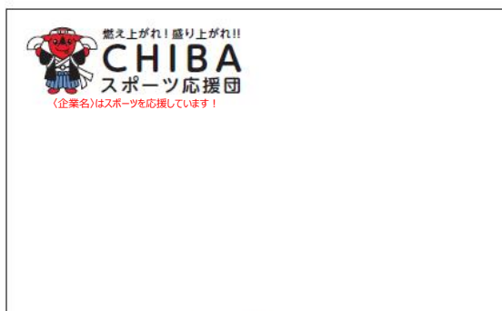
名刺 / 55×90mm

※「燃え上がれ!盛り上がれ!! CHIBAスポーツ応援団」が読み取れるサイズとしてください