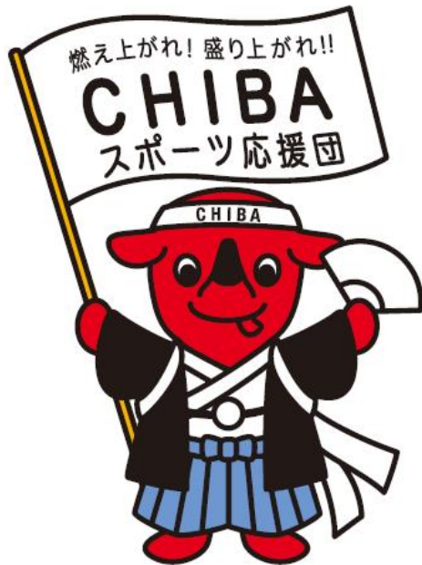
スポーツ応援チーバくん