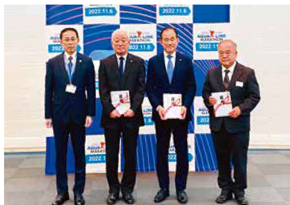
※2023年1月16日（月） 日本赤十字社千葉県支部においてチャリティ贈呈式を実施

寄付先：日本赤十字社千葉県支部 財団法人日本パラスポーツ協会 財団法人千葉県教育振興財団 1団体あたり 1,870,100円