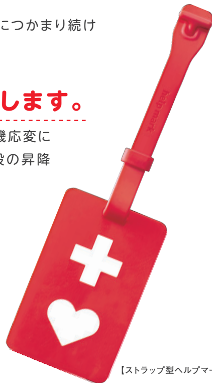
【ストラップ型ヘルプマーク】

視覚障害者や聴覚障害者等の状況把握が難しい方、肢体不自由者等の自力での迅速な避難が困難な方、人が大勢いる避難場所等でストレスを感じる方がいます。