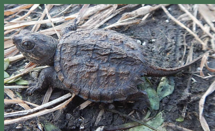
孵化したばかりの子亀

カミツキガメはかつてペットとして人気があり、背甲長 3cm 位の子亀がたくさん売られていました。しかし、大型で、狂暴になることから、飼いきれなくなって捨てられたり、逃げられたりして、その結果野外で繁殖、定着してしまいました。現在、印旛沼流域の広い範囲で生息が確認されています。