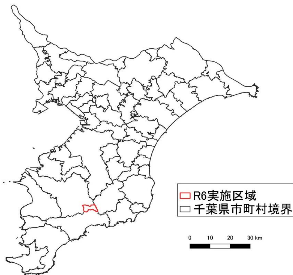
図1 実施区域図（全体）