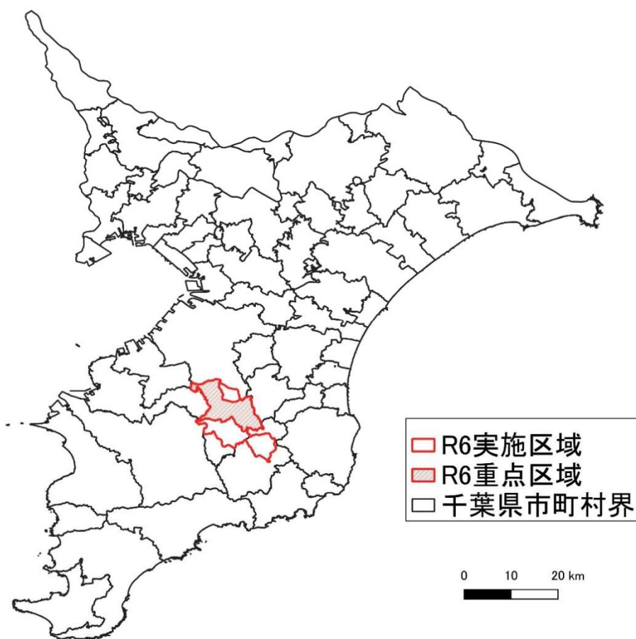
図1 実施区域図（全体）