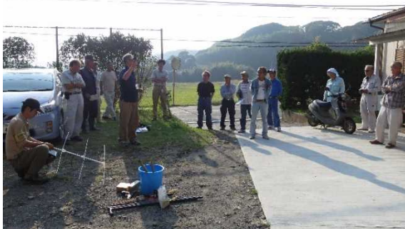
追い払い研修会 館山市会場の様子（説明風景）