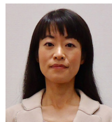
名古屋市立大学病院 中央臨床検査部 部長