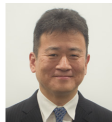
豊橋市歯科医師会 会長