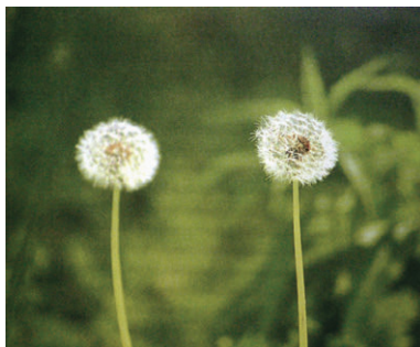
「病者が病者でいられる社会」1990年5月 万博日本庭園