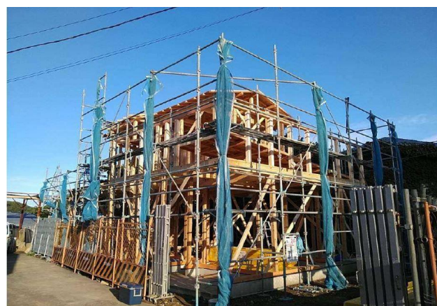
駐在所（木造・県外産）