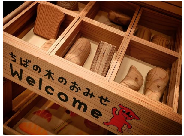
木育用のおもちゃ（県産材）