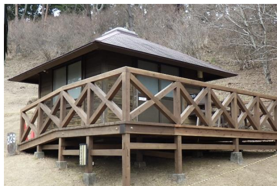
ウッドデッキ（県産材）