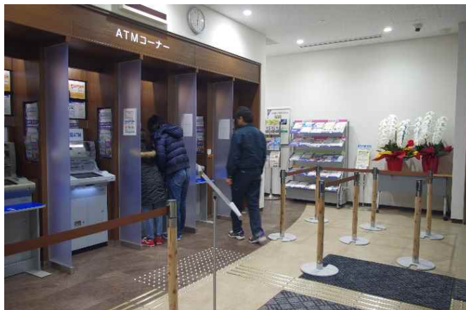
京葉銀行様 ATMコーナー