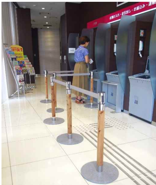
千葉興業銀行様 ATMコーナー