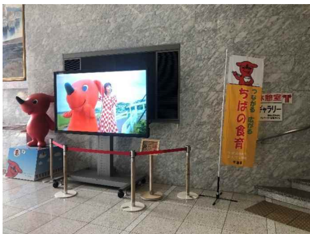
千葉県庁 エントランス