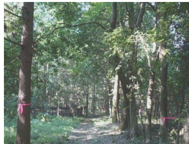
シラカシ並木整備前