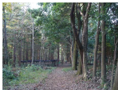
シラカシ並木整備後