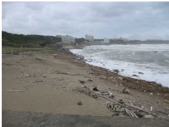
(平成 27 年 10 月)