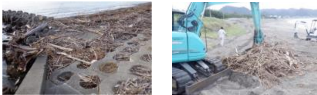
図6-36 重点区域の様子（鋸南町）（令和4年9月）