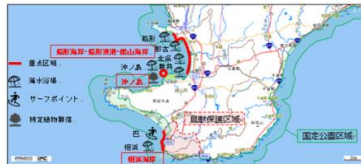
図6-3 重点区域位置図（館山市）