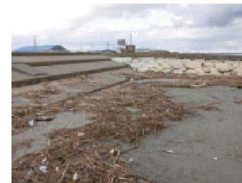
図6-8 重点区域の様子(旭市) (令和2年5月)