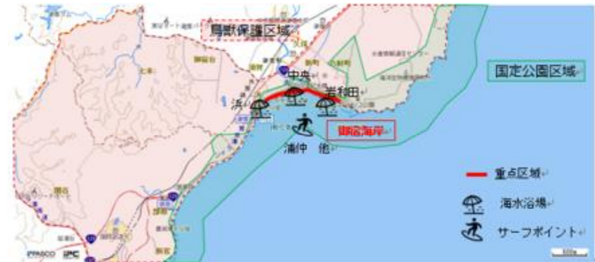
図6-31 重点区域位置図 (御宿町)