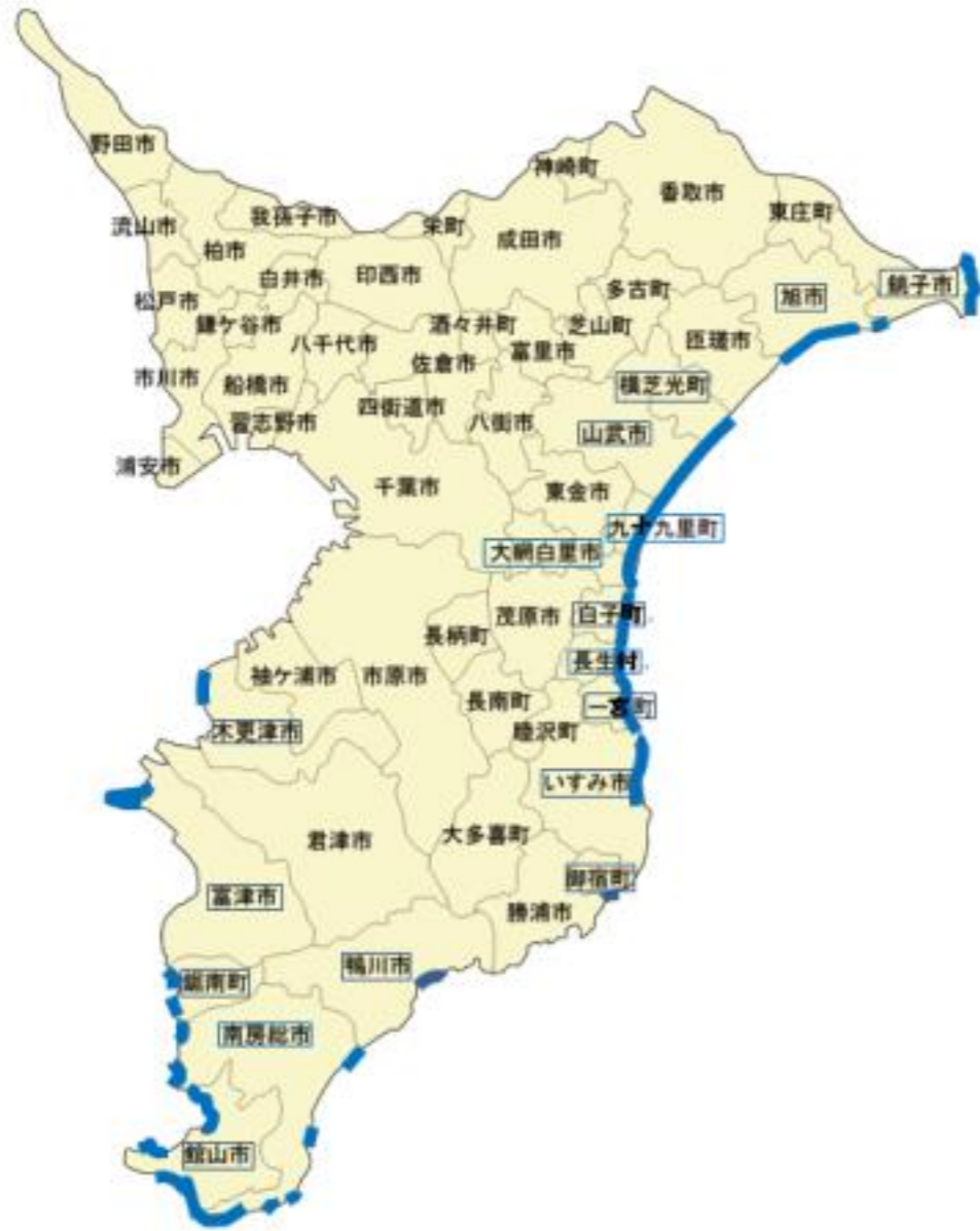
图7 重点区域位置图