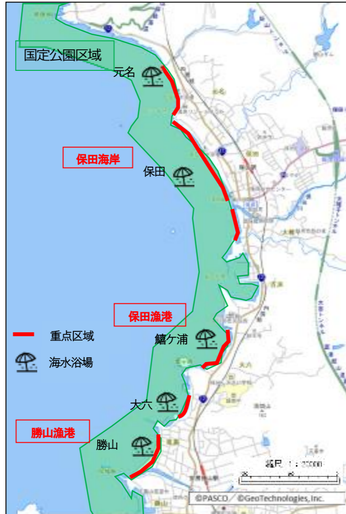
図6-35 重点区域位置図（鋸南町）