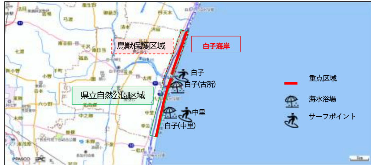
図6-31 重点区域位置図(白子町)