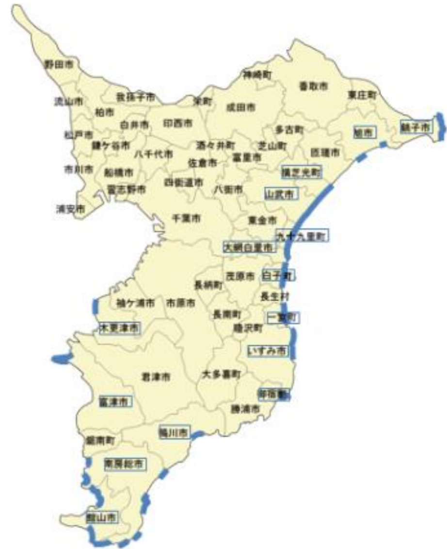
图7 重点区域位置图