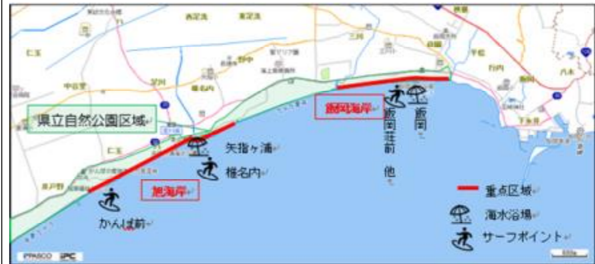
図6-7 重点区域位置図(旭市)