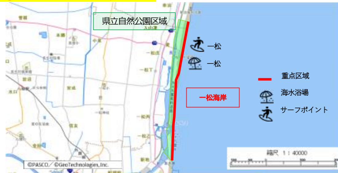
図6-29 重点区域位置図(長生村)