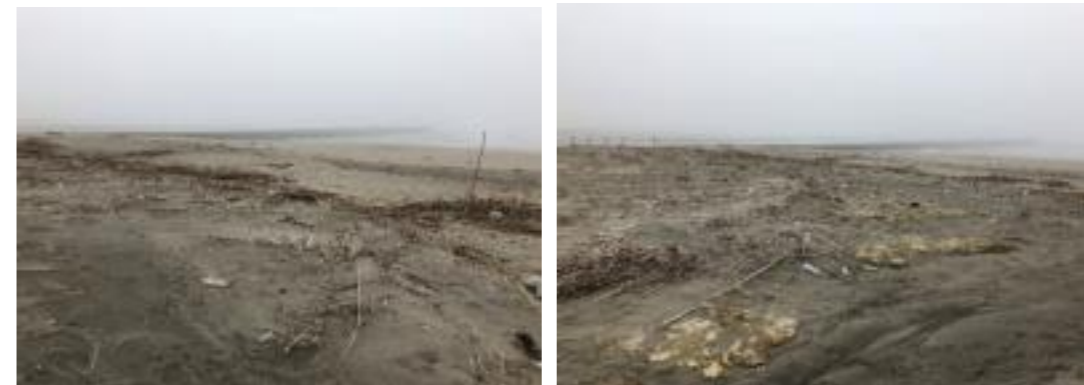
図6-30 重点区域の様子(白子町) (令和2年5月)