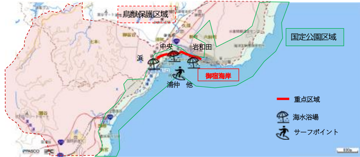
図6-33 重点区域位置図 (御宿町)