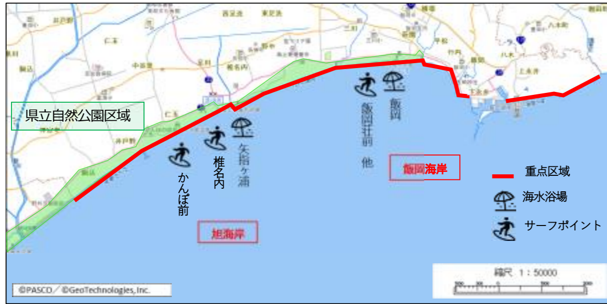
図6-7 重点区域位置図(旭市)