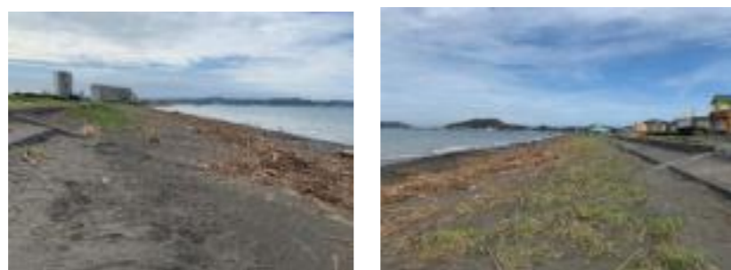
図6-4 重点区域の様子（館山市）（令和元年9月）