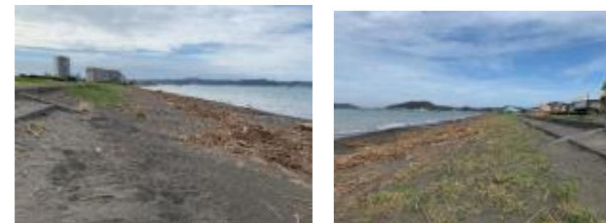
図6-4 重点区域の様子（館山市）（令和元年9月）