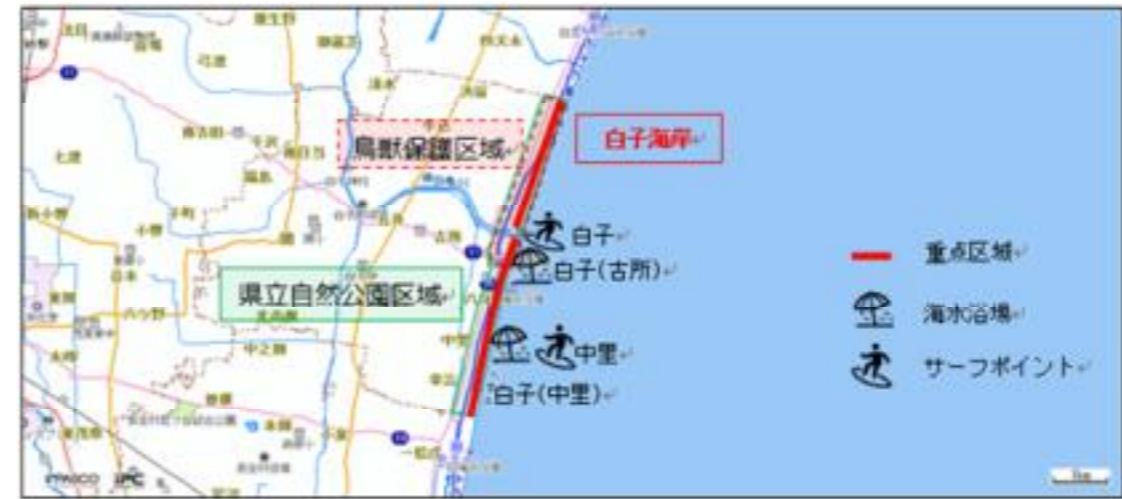
図6-29 重点区域位置図(白子町)