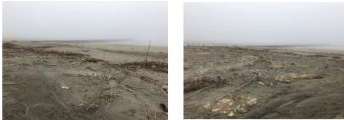
図6-32 重点区域の様子(白子町) (令和2年5月)