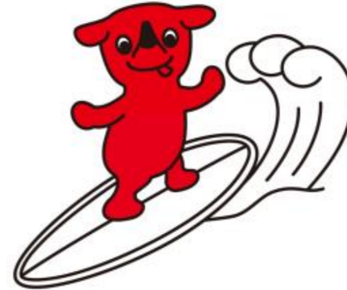
千葉県マスコットキャラクター「チーバくん」