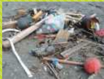
ビーチパラソル・サンダル・ 空き缶・PET ボトルなど