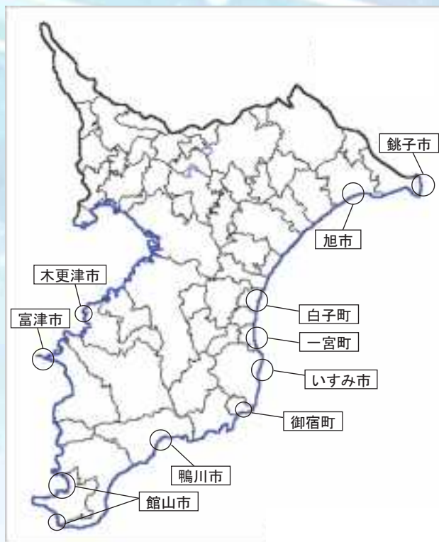
「千葉県海岸漂着物対策地域計画」重点区域地図