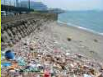
空き缶やペットボトルなど