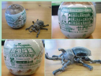
「アースカプセル 昆虫採集」(株)バンダイ