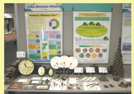
千葉県産木質プラスチック製品の展示状況