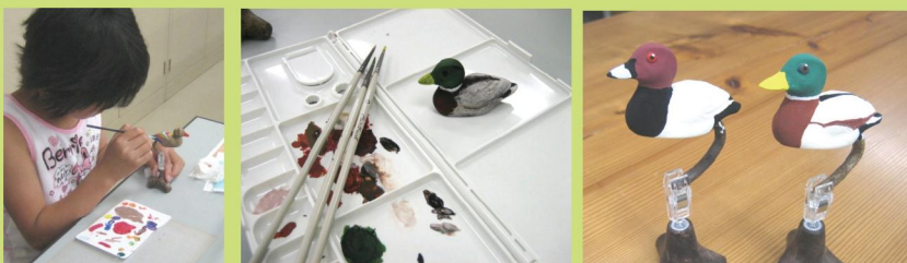
エコデコイ「こがもちゃん」 阿久津樹脂工業