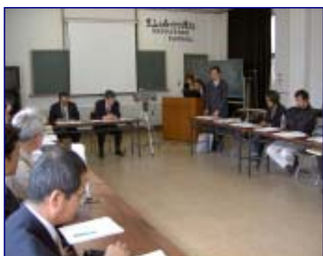
第 3 回共同研究会議

第 3 回「木質バイオマス利活用実用化促進事業」共同研究会議が、3 月 16 日 (水) 県森林研究センターで開催されました。