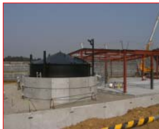
メタン発酵槽 (山田町)

現在のスケジュールでは、完成 (建築確認) は 6 月末 ~ 7 月初めを予定しています。