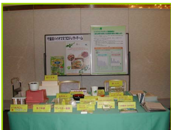
バイオマスプロジェクトチームの展示

バイオマスプロジェクトチームは、昨年ウィスコンシン州に職員を派遣するなどバイオマス分野で相互交流があります。