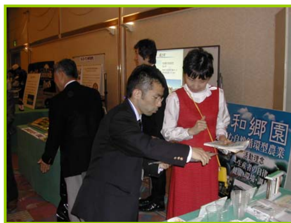
バイオマスプラスチック製品の説明風景