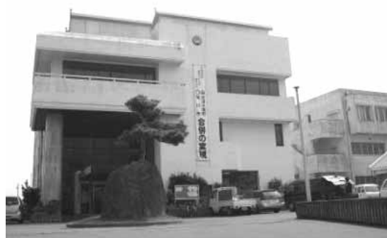
旧天津小湊町役場（現天津小湊支所）