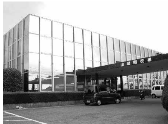
旧山武町役場（現山武出張所）