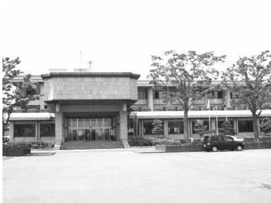
旧成東町役場（現山武市役所）