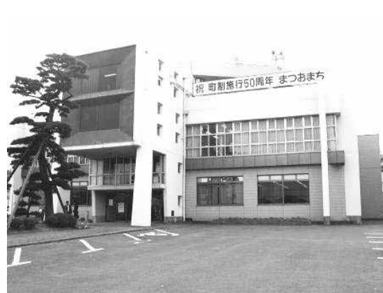
旧松尾町役場（現松尾出張所）