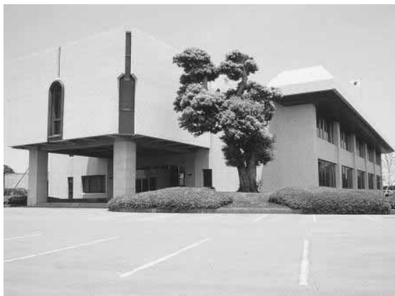
旧蓮沼村役場（現蓮沼出張所）