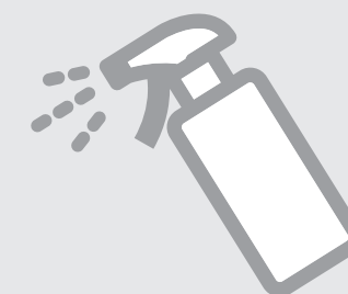
記載台・ 鉛筆の消毒