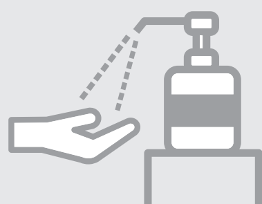
アルコール 消毒液の設置