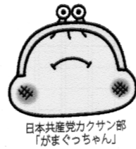
日本共産党の「チェンジ」がまぐつちゃん

アベノミクスで貧困と格差はますます拡大し、貯蓄ゼロが全世帯の35%に。所得の低い人に重い消費税は、延期でなく断念すべきです。