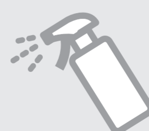
記載台・ 鉛筆の消毒