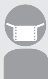
事務従事者の マスク着用