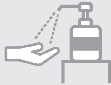
アルコール 消毒液の設置