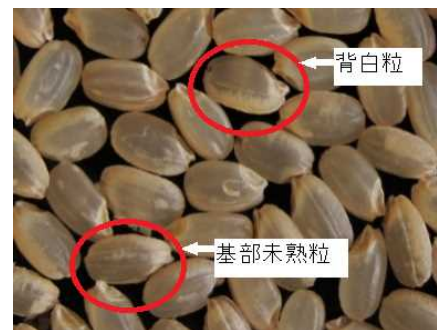
写真 高温登熟障害により発生した基部未熟粒と背白粒

https://www.pref.chiba.lg.jp/ninaite/network/field-r2/sui-2020-07.html