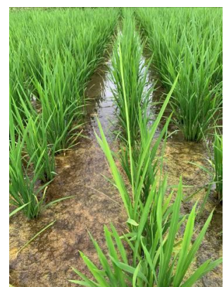
写真1 イネばか苗病