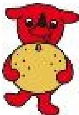
千葉県マスコットキャラクター チーバくん