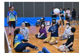
パラバレーボール(座位)