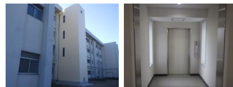
エレベーター設置の例(流山高校)