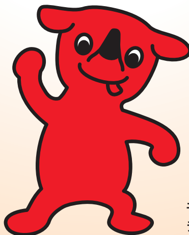
千葉県マスコットキャラクター チーバくん

千葉県は 一人ひとりが様々な違いがある個人として尊重され、 誰もが参加し、その人らしく活躍できる社会の 実現を目指します