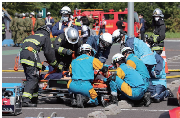
九都県市合同防災訓練（千葉市会場）