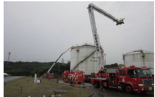
石油コンビナート等防災訓練