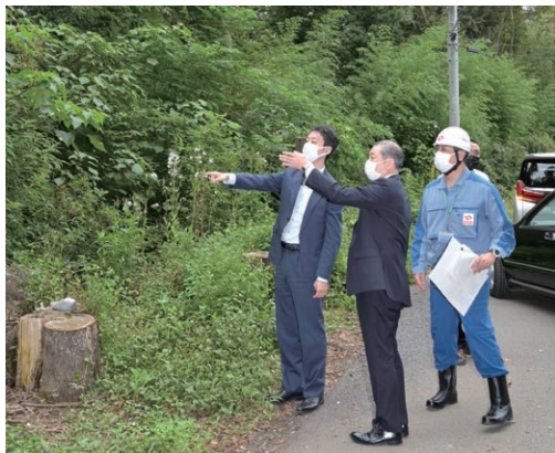
東京電力パワーグリッド（株）による電力強靱化の取組（重要施設周辺における停電の復旧早期化対策）の視察