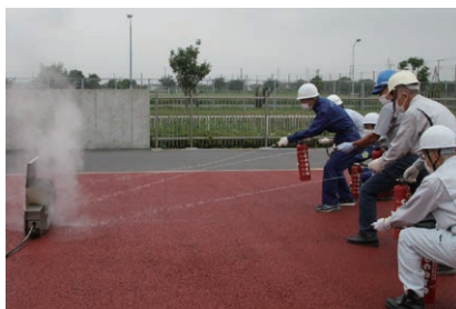
防災研修センターにおける研修(自主防災組織向け)