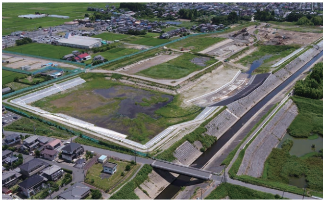
一宮川第二調節池の増設（工事状況）