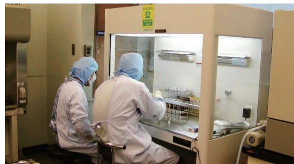
衛生研究所での検査の様子