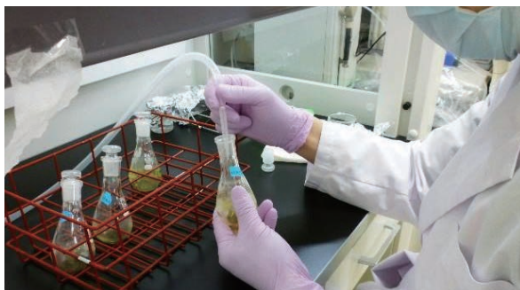
衛生研究所での検査の様子