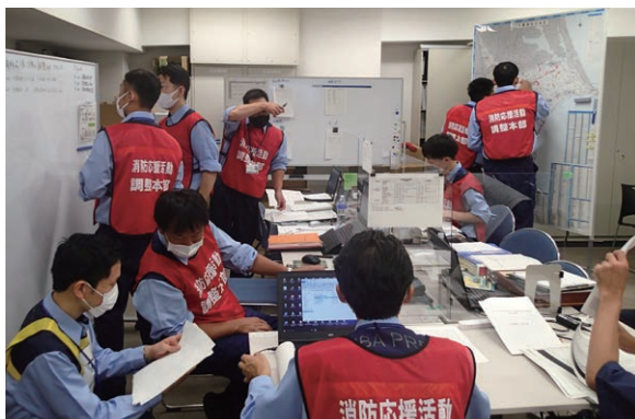
災害対策本部図上訓練