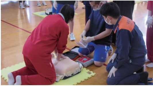
消防防災活動に関する出前講座

地域における消防防災力の向上を図るため、市町村と連携して、消防の広域化の推進、市町村消防防災施設・設備の整備に対する支援、消防団員の確保や消防団の活性化のための普及啓発等に取り組みます。