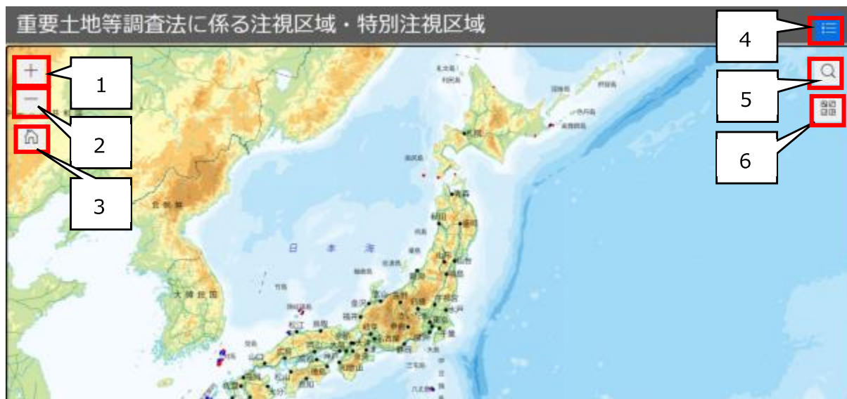
表 1 画面上の各機能（ボタン）の説明

なお、当マニュアルで示している画面は PC の画面であり、スマートフォンでは画面サイズの違い等により見栄えが異なる場合があります。