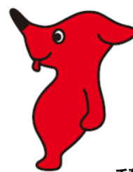
千葉県PRマスコット キャラクターチーバくん