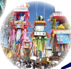
茂原七夕まつり 茂原市