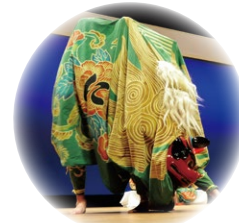
西ノ下の獅子舞 九十九里町