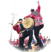
銚子ばやし はね込み太鼓 銚子市