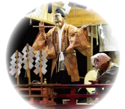
八劔神社の神楽 千葉市