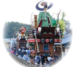
佐原の大祭 香取市