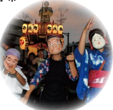
ばか面おどり 船橋市