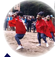
三島の棒術と羯鼓舞 君津市