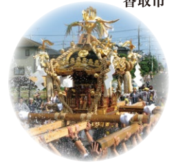
八重垣神社祇園祭 神輿渡御 匝瑳市