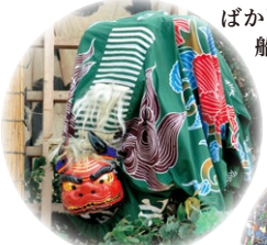
北之幸谷の獅子舞 東金市