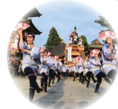
成田祇園祭 成田市