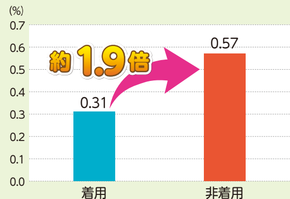
図2 ヘルメット着用状況別の致死率比較(令和元年～令和5年合計)