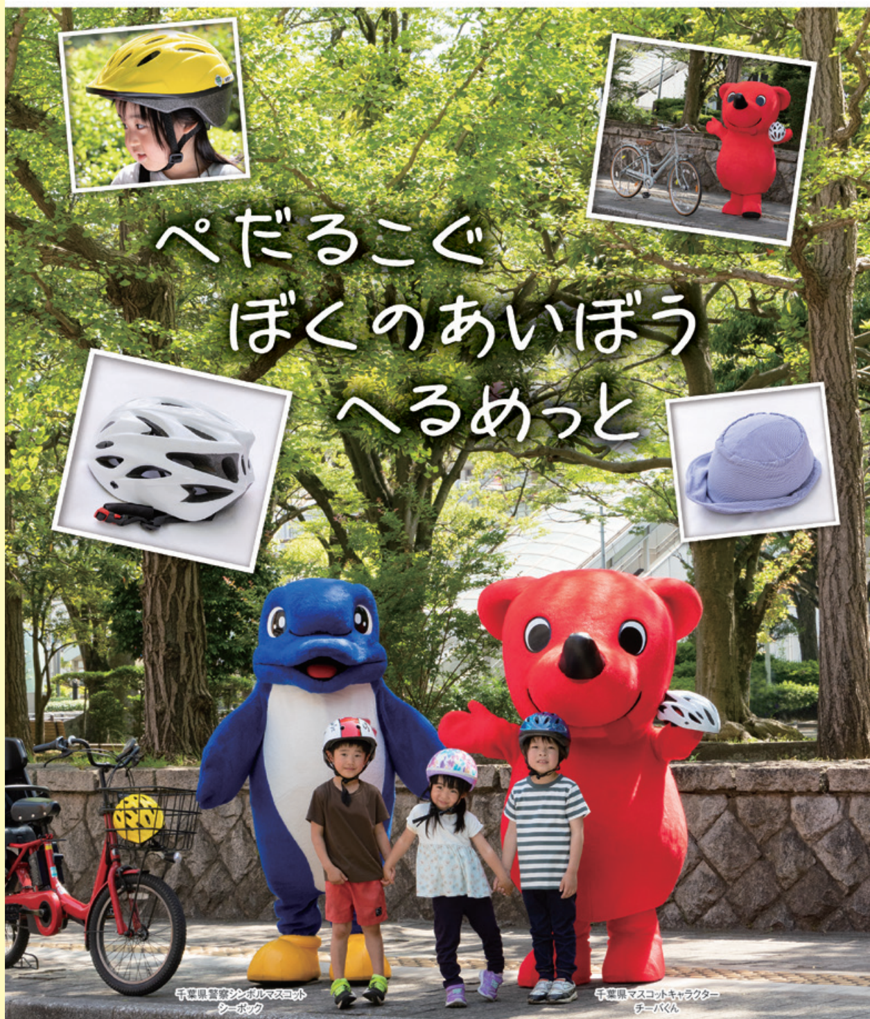
千葉県警シンボルマスコット シーポック