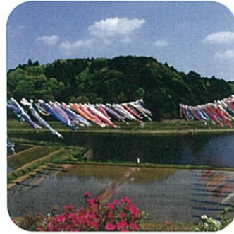
いきいきやまだ 鯉のぼりまつり