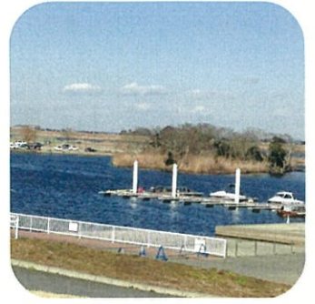
道の駅 水の郷さわら