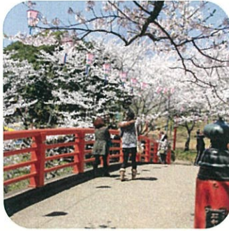
水郷おみがわ桜つつまつり