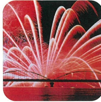
水郷おみがわ花火大会