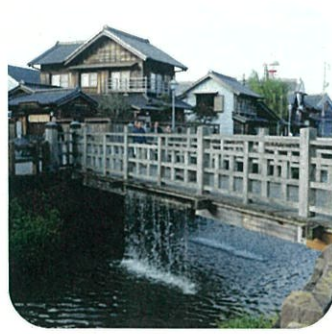
小野川じゃあじゃあ橋(槌橋)