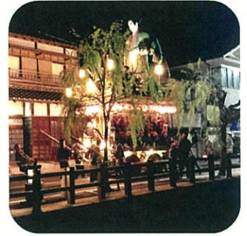
佐原の大祭秋祭り