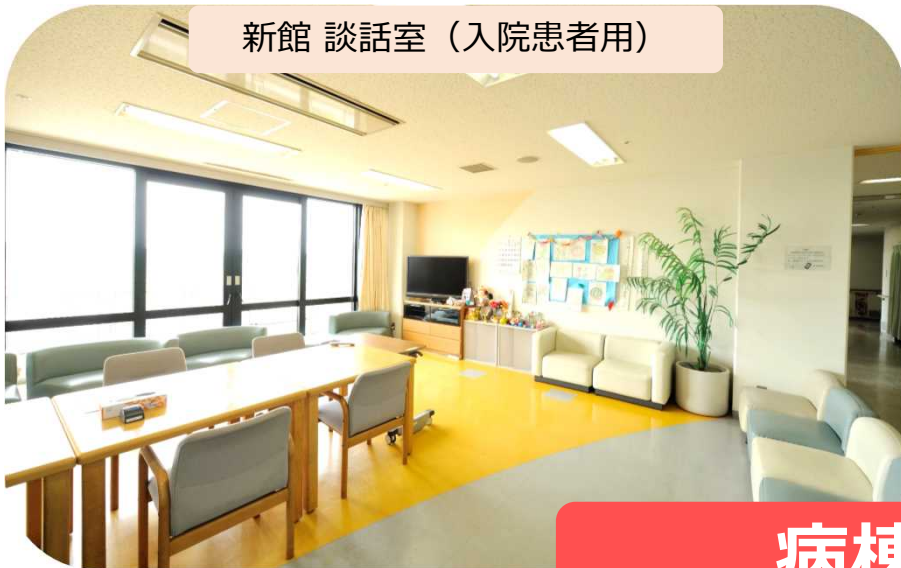
新館 談話室 (入院患者用)