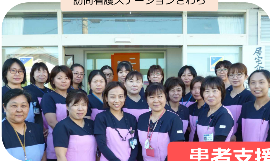
訪問看護ステーションさわら