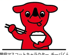
千葉県マスケットキャラクター チーバくん

開催日時: 令和5年12月4日(月)～12月15日(金) ※土日休み 営業時間: 10:00～21:00 主催: 千葉県 問い合わせ先: 株式会社生産者直売のれん会 TEL:03-5827-7530