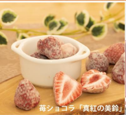
莓ショコラ「真紅の美鈴」