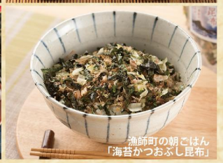
漁師町の朝ごはん「海苔かつおぶし昆布」