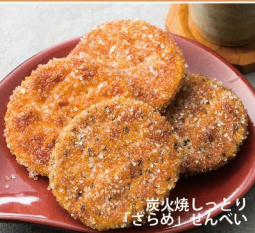
炭火焼しっとり「さらめ」せんべい