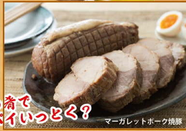
マーガレットポーク焼豚