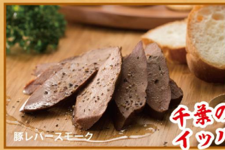
豚レバースモーク