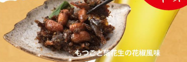
もつこと花生の花椒風味