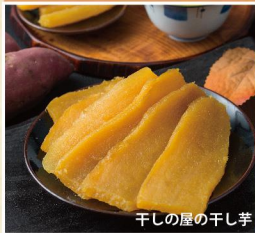
干しの屋の干し芋