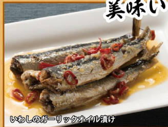
いわしのがーりくくのオイル漬け