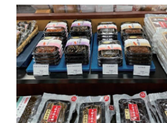
お土産売場の様子

成田山新勝寺の参道での販売 1000年以上の歴史を持ち、年間1000万人以上が訪れる成田山新勝寺の表参道で「茂平の佃煮」として、弊社の佃煮が成田土産として愛されています。