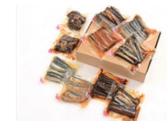
様々な商品にてご要望をお伺いします

「いわし銚子煮」や「真いわし生姜煮」は「全国水産加工たべもの展」水産庁長官賞を受賞するなど、様々な商品で賞を頂戴し、ご評価いただいております。