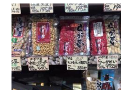
道の駅うまかつの里様 販売の様子

県内での販売実績 「道の駅 木更津うまかつの里」様や弊社直売所にて販売しております。