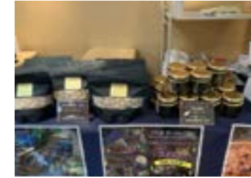
店舗での販売の様子

百貨店での取り扱い実績 「京阪百貨店」様、「高島屋 柏店」様、「井筒屋百貨店」様、「一畑百貨店」様、「岡島百貨店」様、「川徳百貨店」様などでお取り扱いいただいております。