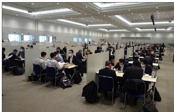
令和5年度に実施した「九都県市合同商談会2024」の商談風景 (会場:パシフィコ横浜 アネックスホール)

首都圏産業の国際競争力の強化を図るため、平成20年度から九都県市(埼玉県、千葉県、東京都、神奈川県、横浜市、川崎市、千葉市、さいたま市、相模原市)が連携して合同商談会を開催し、今回で17回目を迎えます。