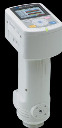
コニカミノルタ(株) CM-700d